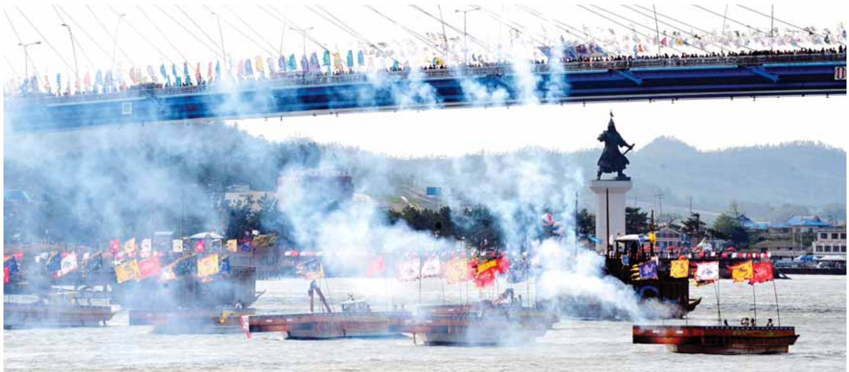
불멸의 해전사 명량대첩 재연