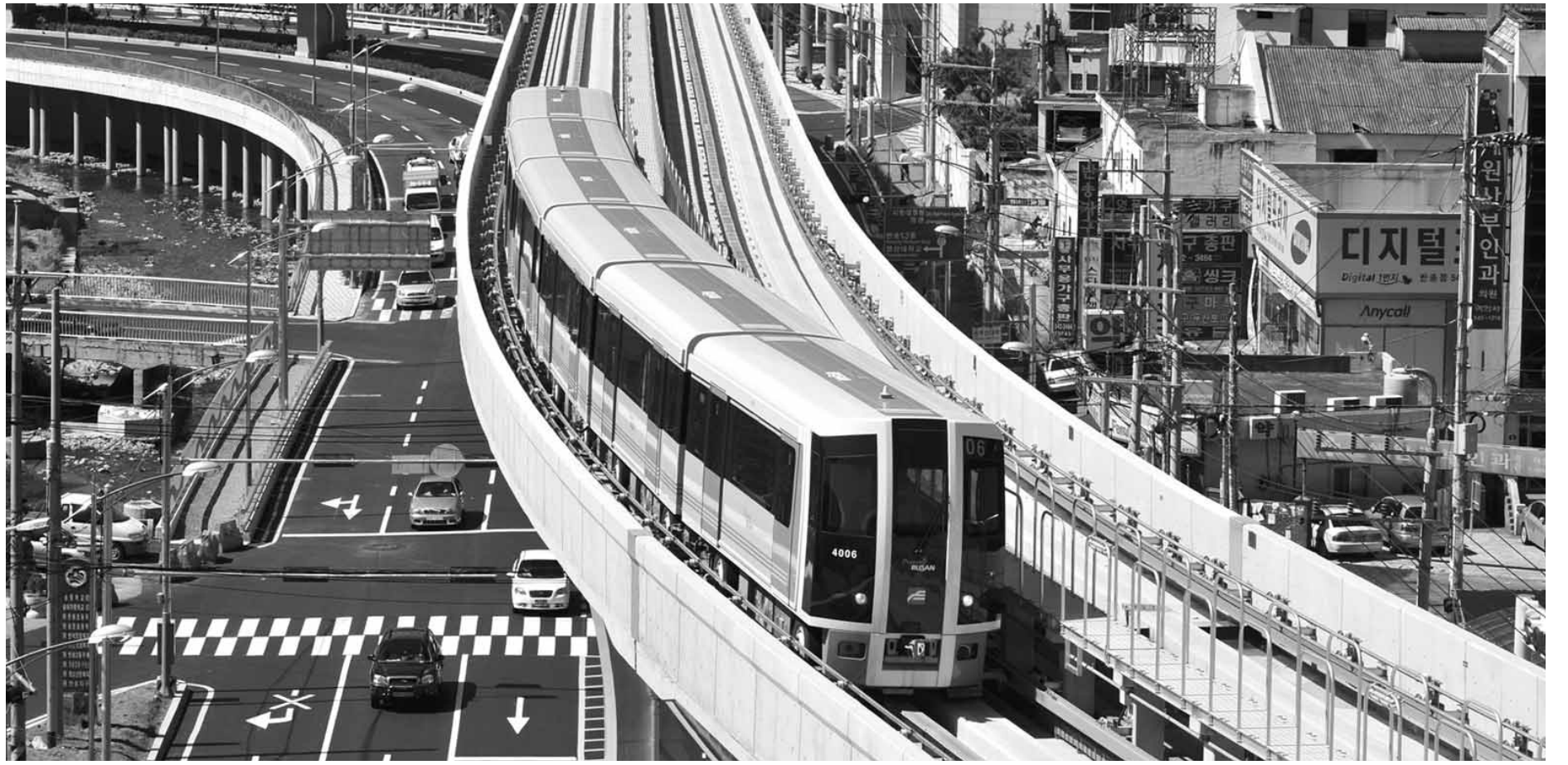
개통 26년 역사를 가진 부산 도시철도는 규모나 운영면에서 선진 도시철도의 모범을 달리고 있으나 고질적인 적자와 추가 노선의 건설 타당성을 놓고 여전히 논란이 일고 있다. 국내기술로 개발된 경전철로 운행되고 있는 4호선.

또 도시철도 기본계획에 따라 5호선이 계획되고 수개의 연장선과 주선을 보조할...