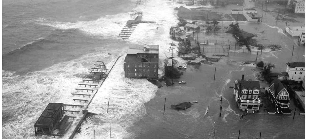
괴물 허리케인 '샌디'가 29일(현지시간) 오후 8시 미국 뉴저지주 애틀랜틱 시티 근처 해안에 상륙, 강한 바람과 함께 폭우가 쏟아져 뉴저지와 뉴욕, 메릴랜드, 펜실베이니아, 코네티컷 주 등에서 샌디로 인한 사망자 수가 이날 최소 10명에 이르는 것으로 집계됐다. 샌디 상륙 직전 애틀랜틱 시티 초입에 바닷물이 밀려들고 있는 모습.