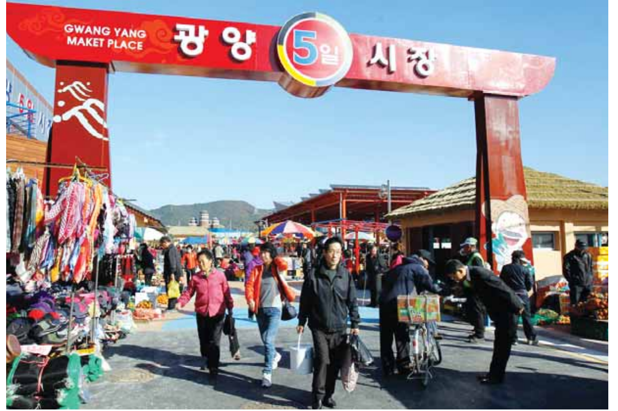
광양읍 5일시장 새단장

광양읍 5일시장이 옛 정취가 있는 문화관광형 시장으로 변모해 1일 개장했다. 광양시는 총 114억6000만원의 사업비를 투입해 지난해 12월부터 광양읍 5일시장 시설현대화 사업을 추진했다. /광양=박영진기자 pyj4079@kwangju.co.kr