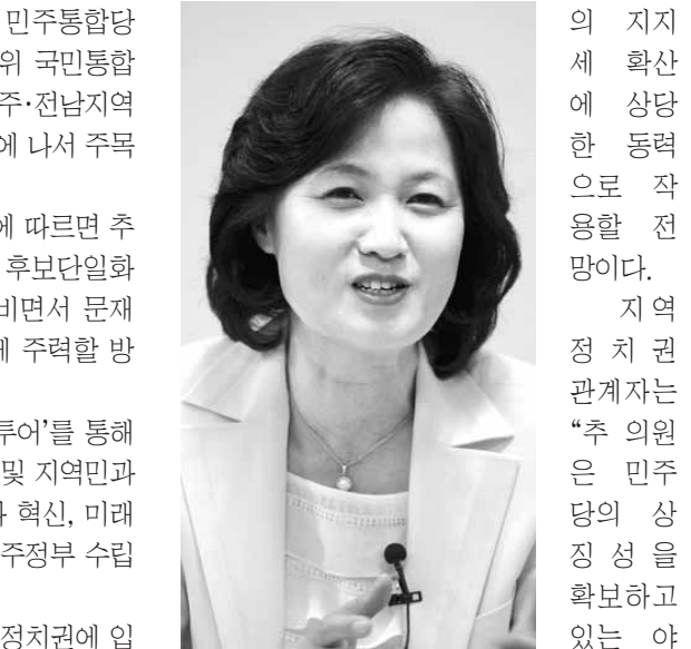
추미애 원내대표가 이번 주말에만 여수 갑을, 익산 갑을, 순천, 광포, 목포 지역구의 대의원 및 당원 대회에 참석, 당원들의 결집과 문 후보에 대해 호소하는 등 촘촘한 스케줄로 광복 행보를 이어갔다.