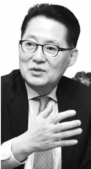
박지원 원내대표가 이번 주말에만 여수 갑을, 익산 갑을, 순천, 광포, 목포 지역구의 대의원 및 당원 대회에 참석, 당원들의 결집과 문 후보에 대해 호소하는 등 촘촘한 스케줄로 광복 행보를 이어갔다.

박지원 민주통합당 원내대표가 야권의 후보단일화를 앞두고 DJ(김대중 전 대통령) 정신을 내세우며 문재인 후보에 대한 호남 민심의 지지 확산에 나서고 있다. 당장 이번 주말에만 여수 갑을, 익산 갑을, 순천, 광포, 목포 지역구의 대의원 및 당원 대회에 참석, 당원들의 결집과 문 후보에 대해 호소하는 등 촘촘한 스케줄로 광복 행보를 이어갔다. 특히, 박 원내대표는 문 후보에 대해 섭섭함을 갖고 있는 당원 및 대의원들에게 DJ와의 일화를 소개하며 지지를 호소하고 있다. 지난 3일 남구 지역위원회의 임시 대의원 대회에서 박 원내대표는 "참여정부에 대한 호남 민심의 섭섭함은 잘 알고 있다"며 "하지만 가장 섭섭하고 억울한 사람은 참여정부 만드는데 핵심적 역할을 하고 대북 송금 특검으로 감옥에 수감돼 13번의 전신마취를 하고 수술을 한 박지원"이라고 말했다. 박 원내대표는 이어 "감옥에 다녀온 이후, 억울하고 분한 마음을 얘기하고 다니자 DJ가 사저로 불러 '이명박 정부가 하고 있는 꼴을 보면서 이러느냐, 힘을 합쳐 민주정부를 만들어 내는 노력을 해야 한다'고 질책했다"며 "이후 민주당의 재건과 정권 창출을 위해 온 몸을 던지고 있다"고 밝혔다. 박 원내대표는 특히 "DJ는 서거 직전까지