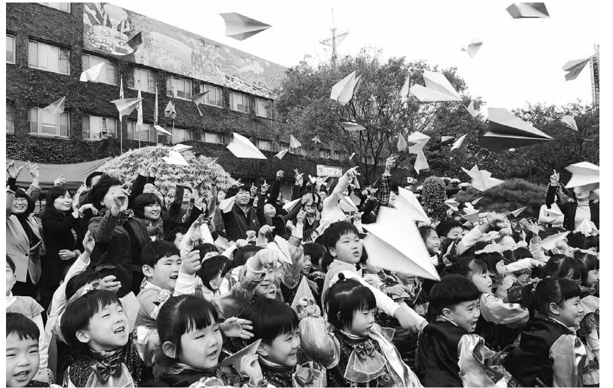
“나로호 발사 성공하세요” 6일 오전 광주 북구청 광장에서 어린이들이 한국 최초 우주발사체 나로호 3차 발사의 성공을 기원하며 종이비행기를 날리고 있다.