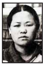
복적으로 구타당해 부은 상태로 눈에 출혈이 생기고 호흡까지 곤란해 입을 약간 벌린 상태였다”라고 밝혔다.

또 “유관순의 수형기록표상 얼굴은 누군가에 의해 심하게 가격당해 부은 것이며 당시 촬영 기법상 왜곡이 일어나 실제 얼굴과는 차이가 있다”고 지적했다.