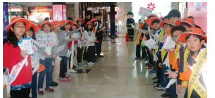
광주서부소방서 직원들과 운천초 119소년단은 최근 ‘제50주년 소방의 날’을 맞아 광주시 서구 유스퀘어 터미널 광장에서 불조심 캠페인을 진행했다.