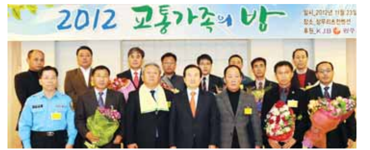
(사)광주시 교통경제인단체협의회(회장 조정래)는 최근 삼무리초컨벤션홀에서 강은태 광주시장과 교통 종사자 및 가족 200여명이 참석한 가운데 '2012 교통가족의 밤'을 개최했다.