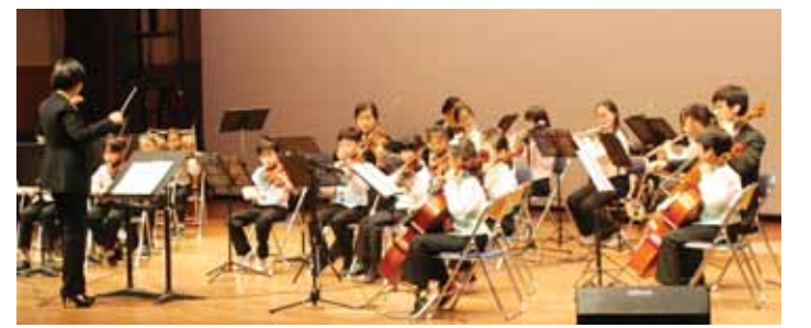
다문화가정 지원 단체인 사단법인 희망나무가 주최하는 '제3회 희망나무 영 오케스트라 연주회'가 26일 광주대 호심관에서 개최됐다.