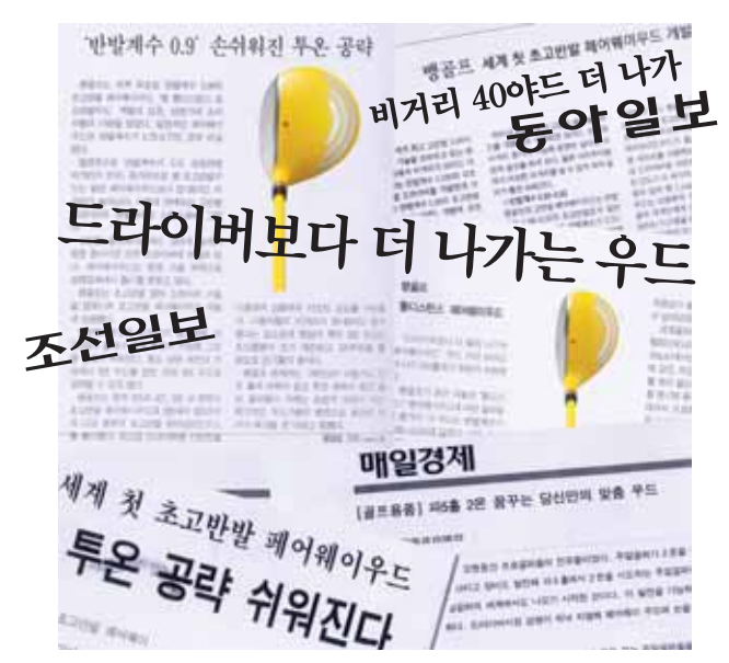
월간 골프먼스트리 조사자료. 설계 기술력 소재 성능 의 차이는 반발계수로 나타난다. 뱅 골프클럽의 기술력을 격찬한 언론

대표전화 : 1544-8070 대리점을 희망하는 골프샵은 031) 781-2051로 문의. 동종업계 최고수준의 A/S정책 ※가격 영원 불변 정책 · Made in Japan or Bang Golf Korea Fitting 신세계 백화점 본 점 (02-310-1538) 신세계 백화점 강남점 (02-3479-1532) 신세계 백화점 영등포점 (02-2639-1536) 신세계 백화점 경기점 (031-695-1845) 신세계 백화점 인천점 (032-430-1563) 신세계 백화점 의정부 (031-8082-0712) 신세계 백화점 부산점 (051-745-1823) 신세계 백화점 충 청 점 (041-640-5753) 신세계 백화점 마산점 (055-240-1406) 신세계 백화점 광주점 (062-360-1402) (주)뱅골프코리아 경기도 성남시 분당구 야탑동 537-3번지 한국골프회관1층 · TEL : 031) 781-2041 · FAX : 031) 781-2031 www.banggolf.co.kr