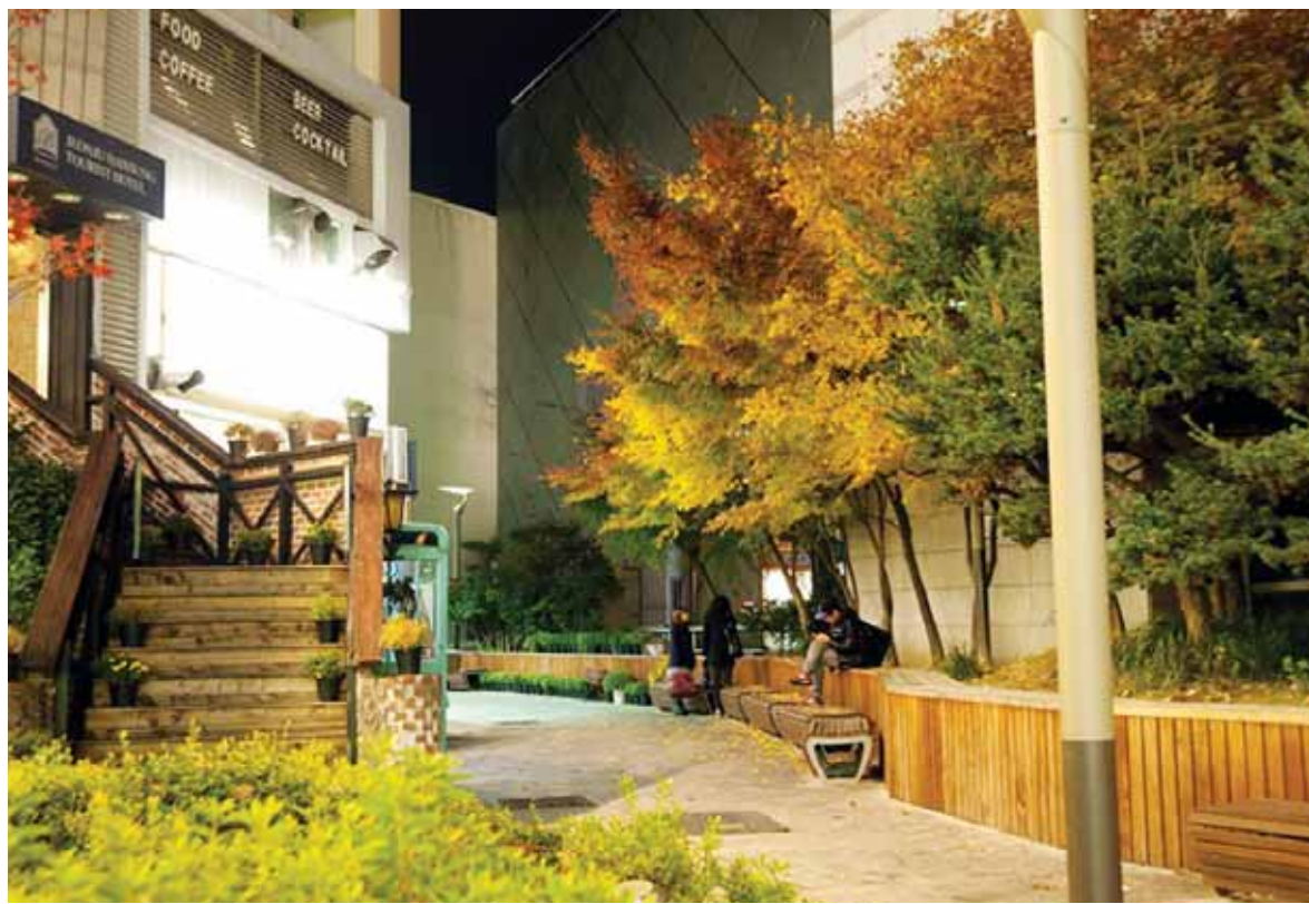
여기는 전주 낭만의 골목길 전주시가 옛 도심인 완산구 고사동 일대의 8개 골목길을 정비했다. 바닥에는 대리석·나무·자갈 등을 조화롭게 깔았으며, 벽면에는 영화인·자연·동화 등을 담은 풍경화, 인물화, 만화 등을 그렸다.

험, 자작나무 숲 해설, 야생동물 흔적 찾기 등 다양한 활동을 하게 된다. 또 겨울철 자연 속에서 자연스럽게 환경·생태를 느끼고 설경을 만끽할 수 있는 프로그램이 운영된다. 문의(063-625-8911) /남원=백선기자 bs8787@