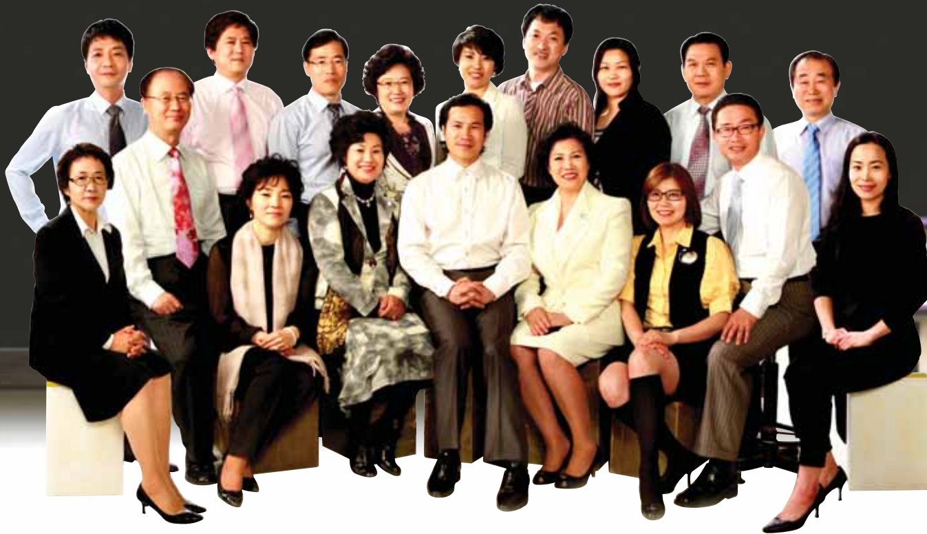
평생교육발전을 위해 뛰는 (사)한국평생교육발전협의회 임원단