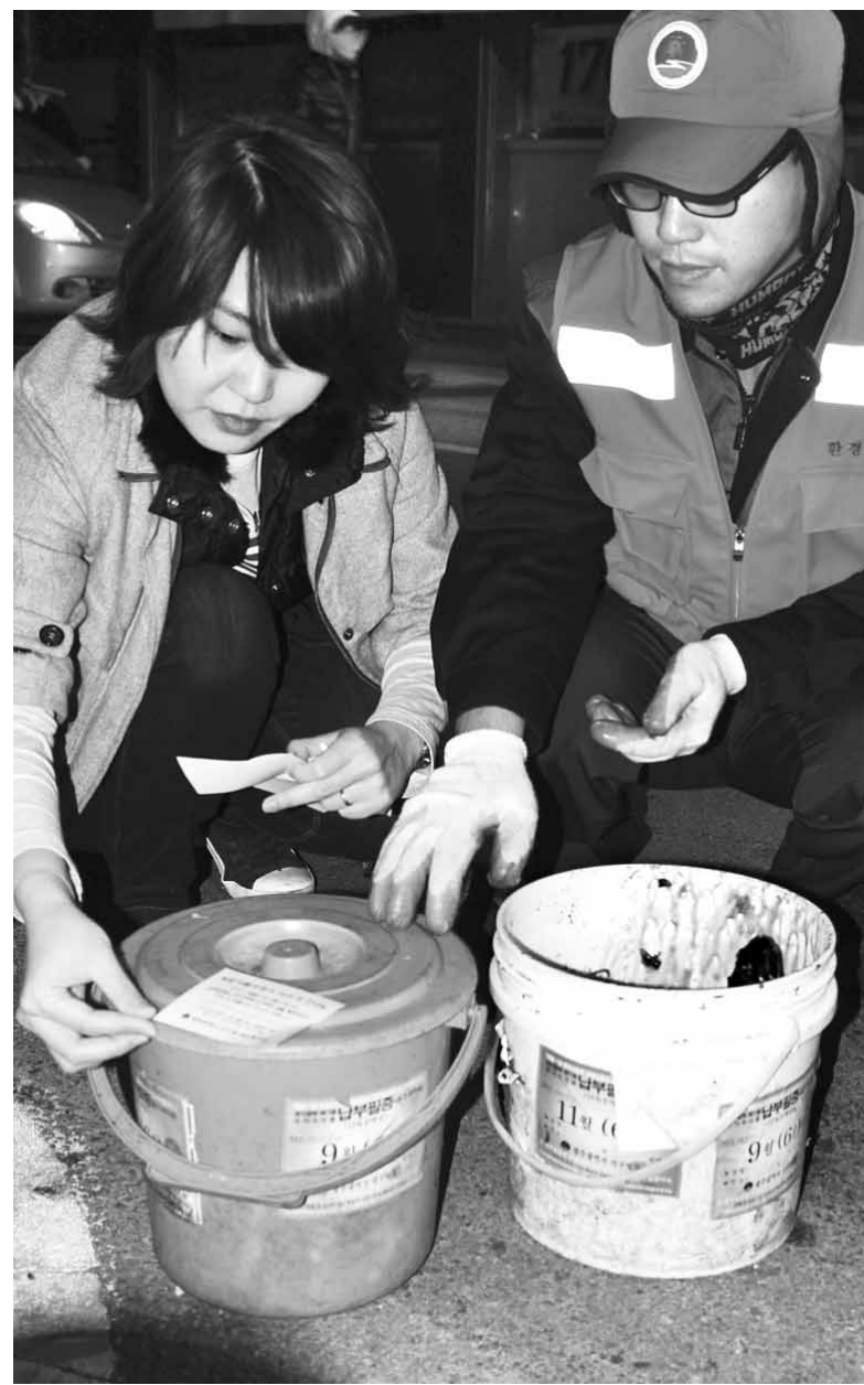
광주지역 단독주택을 대상으로 전면실시된 음식물 쓰레기 종량제 시행 첫날인 지난 1일, 광주시 서구 관계자가 종량제 스티커가 붙지 않은 음식물 쓰레기 용기에 ‘계도용 스티커’를 붙이고 있다.

박정렬기자 halo@kwangju.co.kr