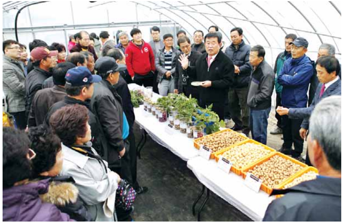
씨감자 배양 이렇게

진도군 농업기술센터는 최근 임회면 광전리 지역특화 시범농장 현지포장에서 기후변화 대응을 위한 농업 실험을 위한 경제작물 시범사업과 인공 씨감자 실증시험 재배 종합 평가회를 가졌다. 진도군은 한국생명공학연구원과 함께 '인공 씨감자 배양사업'을 역점사업으로 추진하고 있다.