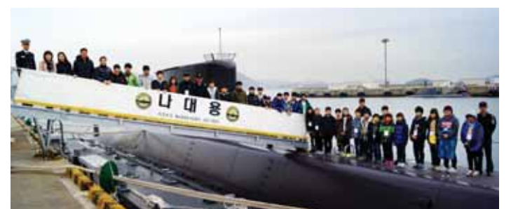
나주시 관내 모범 초·중학생 33명이 최근 나주시와 자매결연을 맺은 경남 진해시를 방문해 해군 8번 잠수함인 '나대응함'을 견학했다.