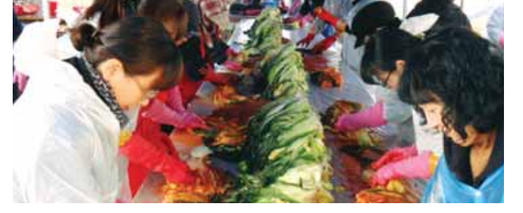
장흥군 장흥읍사무소 직원과 마을이장 등 100여명은 최근 읍사무소에서 사랑의 김장나눔기 행사를 갖고 관내 소외계층 250세대에 김치 1000포기를 전달했다.