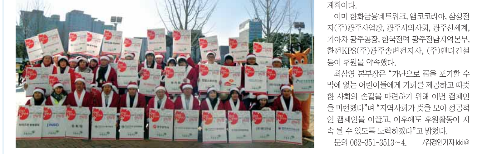
김장김치 및 난방 캠페인은 초록우산 어린이재단이 기업 및 단체, 기관 임직원 등과 함께 김장김치를 담가 광주지역 300여세대에 김장김치와 난방비를 전달함으로써 건강하고 행복한 삶을 지원하는 사업이다.

‘아이들의 잃어버린 소원을 찾을 수 있도록 도와주세요!’ 초록우산 어린이재단 광주지역본부가 주관하고 광주일보가 후원하는 연말 나눔 캠페인 ‘따뜻한 사랑! 따뜻한 나눔!’ ▲초록우산은 든 물레 산타 원정대 등 3가지 주제로 진행될 예정이다. 우리 주위의 소외된 어린이들에게 희망을 선물하기 위해 진행되는 이번 캠페인은 ▲김장김치 캠페인 “맛있는 김치! 맛있는 나눔!” ▲난방 캠페인 “따뜻한 사랑! 따뜻한 나눔!” ▲초록우산은 든 물레 산타 원정대 등 3가지 주제로 진행될 예정이다.