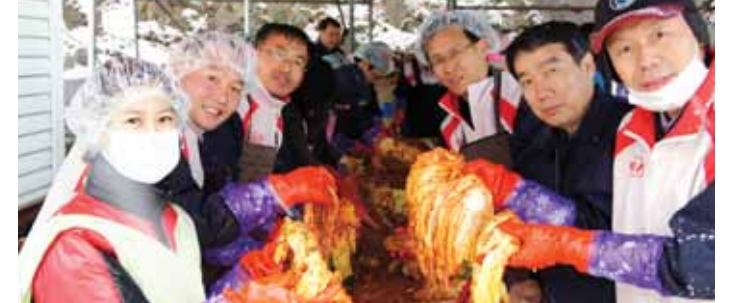
기아자동차 광주2공장(2공장장 오태환) 임직원들은 최근 광주시 광산구 용진육이원에서 김장 김치 600여 포기를 전달하고, 주변 환경정화 활동도 했다.