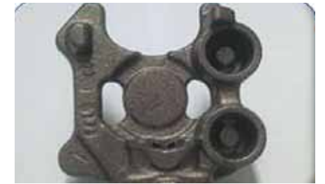
해 기술발전 및 생산활동을 유지해 지역 경제 활성화에 힘을 쏟고 있다"고 말했다.

고객의 기대에 만족하는 주물 및 주철제품을 친환경적이고 경제적으로 생산해 제공한다. 고객에 따라 품질경영체제를 확립하고 기술개발에 주력하고 있다.