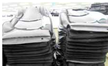
있다. 또 광주대 호심인재개발원과 산학 협동을 통한 기술력 증진에 노력하고 있다.

매출도 크게 성장했다. 2009년 86억원이던 매출이 2010년 124억원, 지난해 204억원으로 2년 사이에 137% 늘었다.