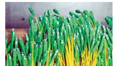
아닌 상생의 길을 모색하는 등 지역산업 발전에도 힘을 쏟고 있다"고 말했다.

최근 3년간 연평균 매출증가율 21.5%, 고용증가율 25.2%로 꾸준히 성장하고 있다. 또 지식경제부와 광주시 북구 등이 매출성장고고용창출 분야에 대한 우수기업으로 선정됐다.