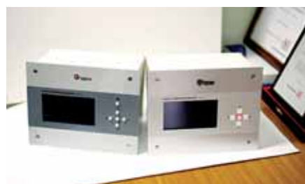
로 시작해 4명으로 늘었다. 매출도 2008년 7400만원에서 지난해 3억6000만원으로 증가했다.

만 아니라 지하철·고속철도 전기계통 등의 화재나 정전 예방이 가능하다"고 말했다. 그동안 수입에 의존해 오던 광 온도센서를 자체 개발해 수입 대체 효과는 물론 원가 절감에도 크게 기여할 것으로 보인다.