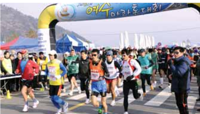
겨울철 국내 최대 마라톤 축제 자리 잡은 '여수마라톤대회'가 지난 6일 5000여 명이 참가한 가운데 여수세계박람회장에서 개최됐다.