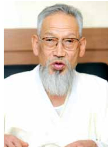
으로 돌아가는 것만이 진정한 삶의 길이자 건강을 되찾는 길이다’, ‘발효음식으로 차린 밥상이 곧 보약이며 건강을 지키는 가장 큰 힘이다’라고 강조한다. /연필뉴스

저자는 ‘바른 생활이 곧 건강하게 사는 길이다’, ‘내 몸을 남에게 맡기지 말고 스스로 주체가 되라’, ‘자연