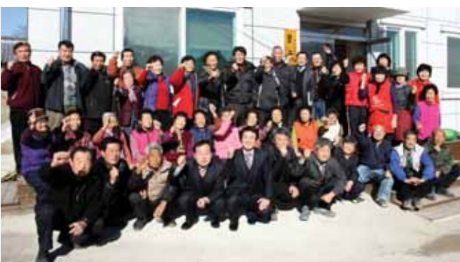
강진군 군동면 봉산마을 주민들의 숙원이던 마을회관이 완공돼 지난 4일 강진원 강진군수를 비롯 김삼용 강진군의회 부의장, 주민 등 100여 명이 참석한 가운데 준공식을 가졌다.