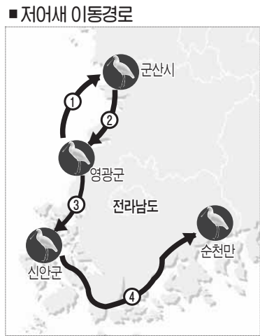
영광 칠산도서 번식 기생악화로 이동 실패한 다시 우리나라로 돌아와

영광 칠산도에서 번식을 마친 천연기념물 제205-1호 ‘저어새’의 이동 경로가 확인됐다. 문화재청 국립문화재연구소(소장 김영원)는 첨단통신기술인 위치추적장치(GCT:GPS-CDMA based Telemetry System) 등을 이용, 영광군 칠산도(천연기념물 제389호 ‘영광 칠산도 갯벌’)에서 번식을 마친 천연기념물 제205-1호 ‘저어새’의 국내·외 이동 경로를 확인했다고 29일 밝혔다.