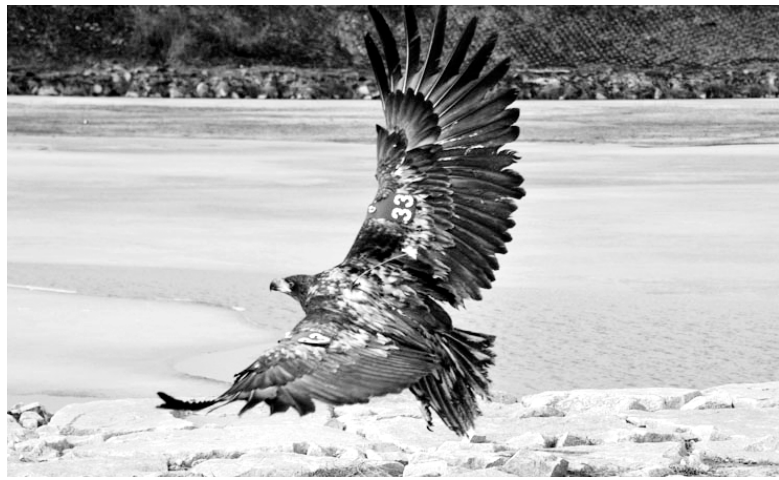
9개월동안 우리나라와 러시아 연해주 지역을 왕복하며 3660여km를 비행한 흰꼬리수리. <국립생물자원관 제공>

흰꼬리수리는 지난해 4월6일 경기도 인천에서 북쪽으로 이동하기 시작해 북한과 러시아 프리모르스키를 거쳐 4월14일 번식지로 추정되는 하바롭스크 아무르강 유역에 도착했다. 8일간 이동거리가 1천810km, 직선거리로는 1천618km에 달한다. 흰꼬리수리는 번식지인 하바롭스크에서 182일 동안 머물다가 지난해 10월13일 남하하기 시작했다. 지난해 12월24일부터 일주일만 북상할 때 거쳤던 프리모르스키에서 보낸 뒤 지난 6일 강원도 강릉까지 날아왔다. 흰꼬리수리는 지난 9일부터 경북 안동에 머물고 있다. 북상할 때와 거의 같은 경로로 이동했고 현재까지 이동거리는 3천660.4km다. 생물자원관은 지난해 1월 탈진 상태에 있던 이 개체를 경기도 인천에서 구조했다. 지난해 2월 인공위성 위치추적장치와 날개표지를 달아 야생에 풀어보낸 뒤 이동경로를 추적했다. /연합뉴스