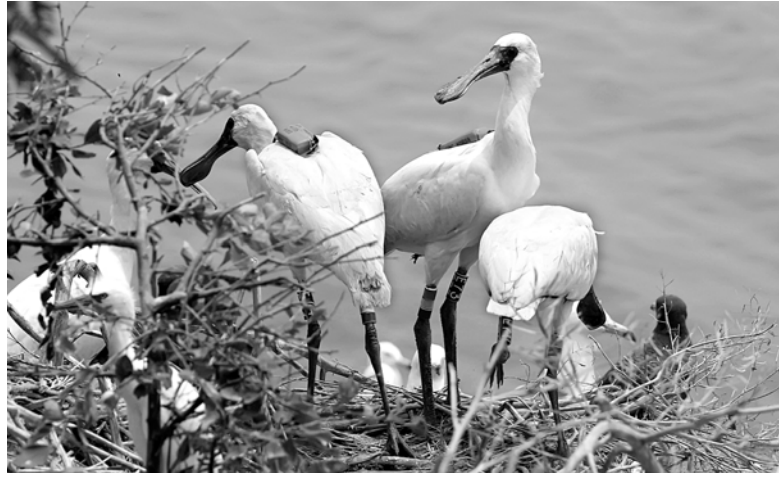
국내·외 이동경로를 확인하기 위해 GCT를 부착한 저어새.

우리나라 최남단의 저어새 번식지인 영광 칠산도에서 이러한 연구가 수행된 것은 처음이다. 문화재연구소 천연기념물센터는 ‘천연기념물(동물) 증식·보존 연구’를 위해 지난해 6월19일부터 올해 1월 중순까지 비영리 전문단체인 한국물새네트워크와 공동으로 저어새의 이동 경로를 조사했다. 영광 칠산도에서 번식을 마친 저어새 중 여섯 마리를 선정해 개체 식별용 가락지를 부착하고 이 중 두 마리에는 위치추적장치(GCT), 한 마리에는 인공위성용 추적장치를 각각 부