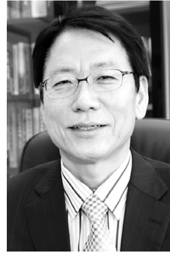
논어촌 상하수도 보급 확대 상하류간 유역 공동체 구축

“환경 보전과 개발의 조화를 통해 건강하고 생명력 있는 쾌적한 광주·전남을 만들도록 최선을 다하겠습니다.” 정회석 영산강유역환경청장은 28일 새해 주요업무 계획과 추진 방향을 설명하며 “국민이 원하는 질 높은 생활환경 개선”을 강조했다. 정회석은 “올해는 새로운 세상에 대한 국민들의 기대와 열원이 어느 때보다 높아진 만큼 해야 할 일도 많아졌다”며 “국민을 위해 봉사하고 국가발전에 헌신한다는 의무감을 가지고 열심히 뛰어올라겠다”고 말했다. 정회석은 우선 “타 지역에 비해 열악한 논어촌 상·하수도 보급률을 높이고 효율적인 토지매수 및 수변구역 관리와 더불어 상류지역 주민을 위한 다양한 지원사업을 추진해 상·하류 모두의 환경복지 향상에 힘쓸 것”이라고 밝혔다. 그는 또 본연의 임무인 영산강·섬진강 수질을 지속적으로 개선하고 보전하는 사업에도 힘써 나갈 것이라고 강조했다. 영산강 수질과 수생태계 복원을 위한 로드맵을 마련하고 먹는 물 수질관리, 유역 측정을 위한 적절