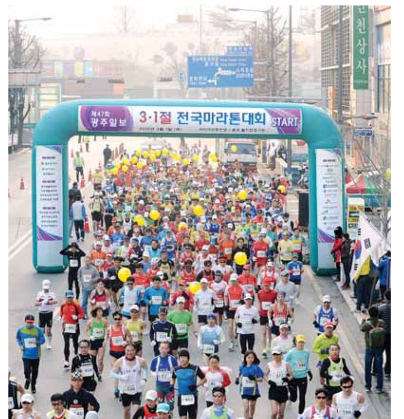
옛 전남도청에서 출발하는 3·1 마라톤의 도심 질주. 지난 대회 풀코스 참가자들이 힘찬 스타트를 끊고 있는 모습.