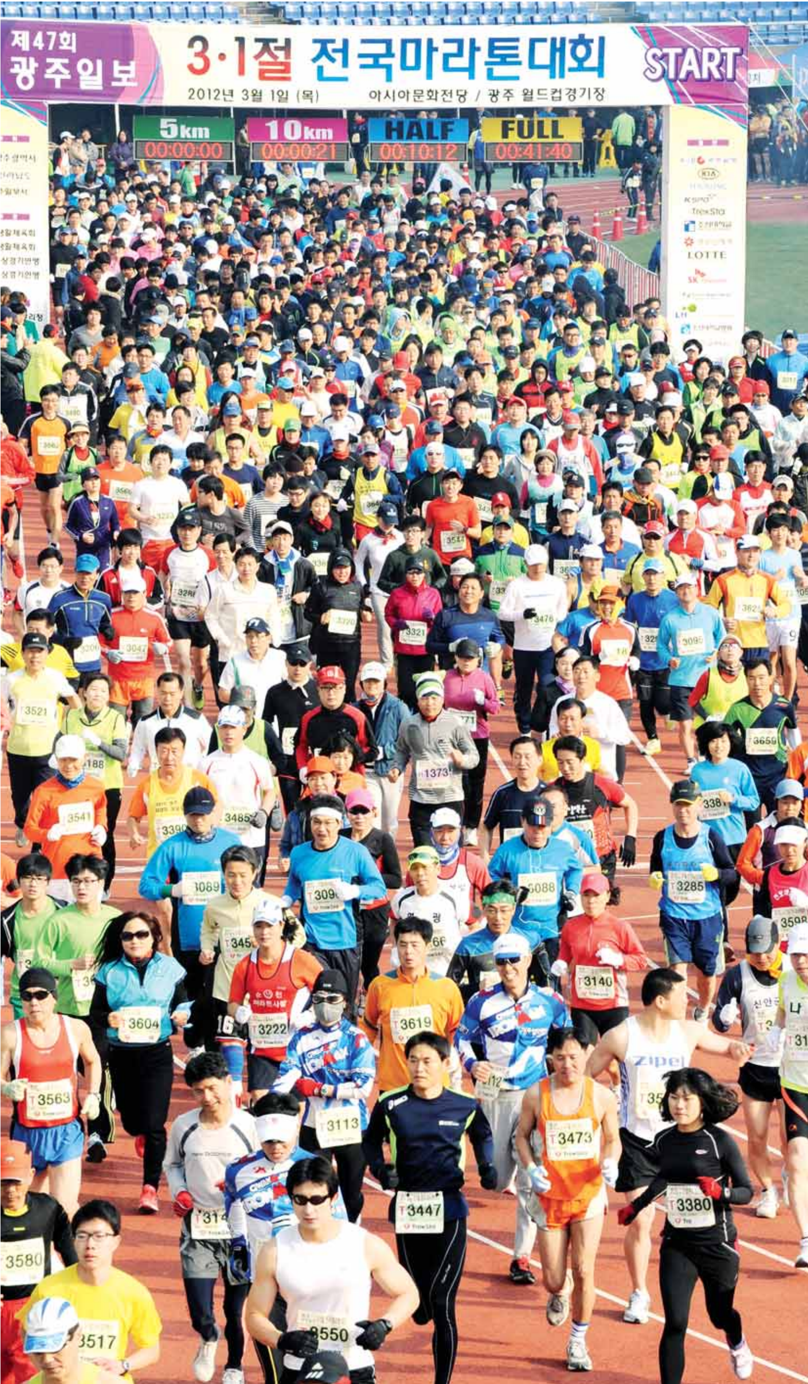
“나는 달린다 고로 존재한다” 호남 마라톤의 대명사 광주일보 3·1 전국마라톤대회 48번째 질주가 펼쳐진다. 옛 전남도청을 출발선으로 하는 명품 풀·하프코스를 달리기 위해 전국 마라토너들의 참가 신청이 줄을 잇고 있다. <광주일보 자료사진>