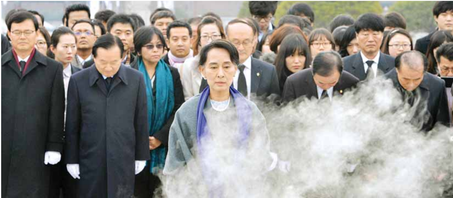
수치 여사 5·18묘지 참배 미안마 민주화운동 지도자인 아웅산 수치 여사가 지난 31일 오전 광주시 북구 운정동 국립 5·18민주묘지를 찾아 참배하고 있다. ▶관련기사 3면