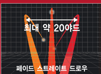
[좌우탄도 이미지도 : RTS웨이트의 조정으로 최대 약 20야드 폭의 좌우탄도 조절이 가능]

※웨이트의 합계중량을 변경하면 스윙밸런스가 변경됩니다.(1.5g으로 약 1포인트 변경됩니다.)