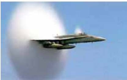
[F22 마하돌파 장면]