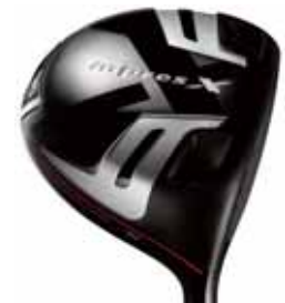
[RMX로 완성된 디자인]