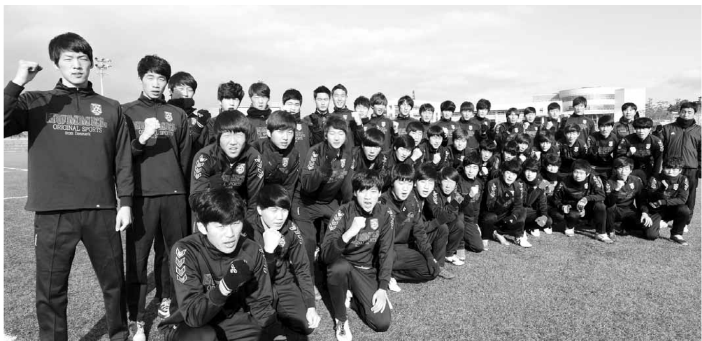
남부대학교 축구부 선수들이 3·1절 마라톤대회 출전을 앞두고 ‘전국대회 4강’ 목표 달성을 위한 힘찬 파이팅을 외치고 있다.