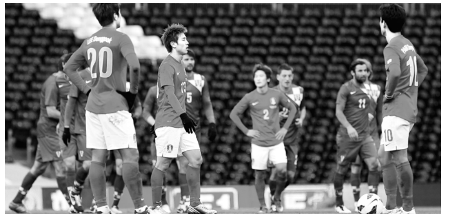
6일 밤(한국시간) 영국 런던 크레이브 코티지에서 열린 축구대표팀과 크로아티아와의 평가전에서 한국의 손흥민과 최재수가 선제골을 허용한 후 아쉬워하고 있다. 대표팀은 이날 경기에서 0-4로 졌다. /연합뉴스