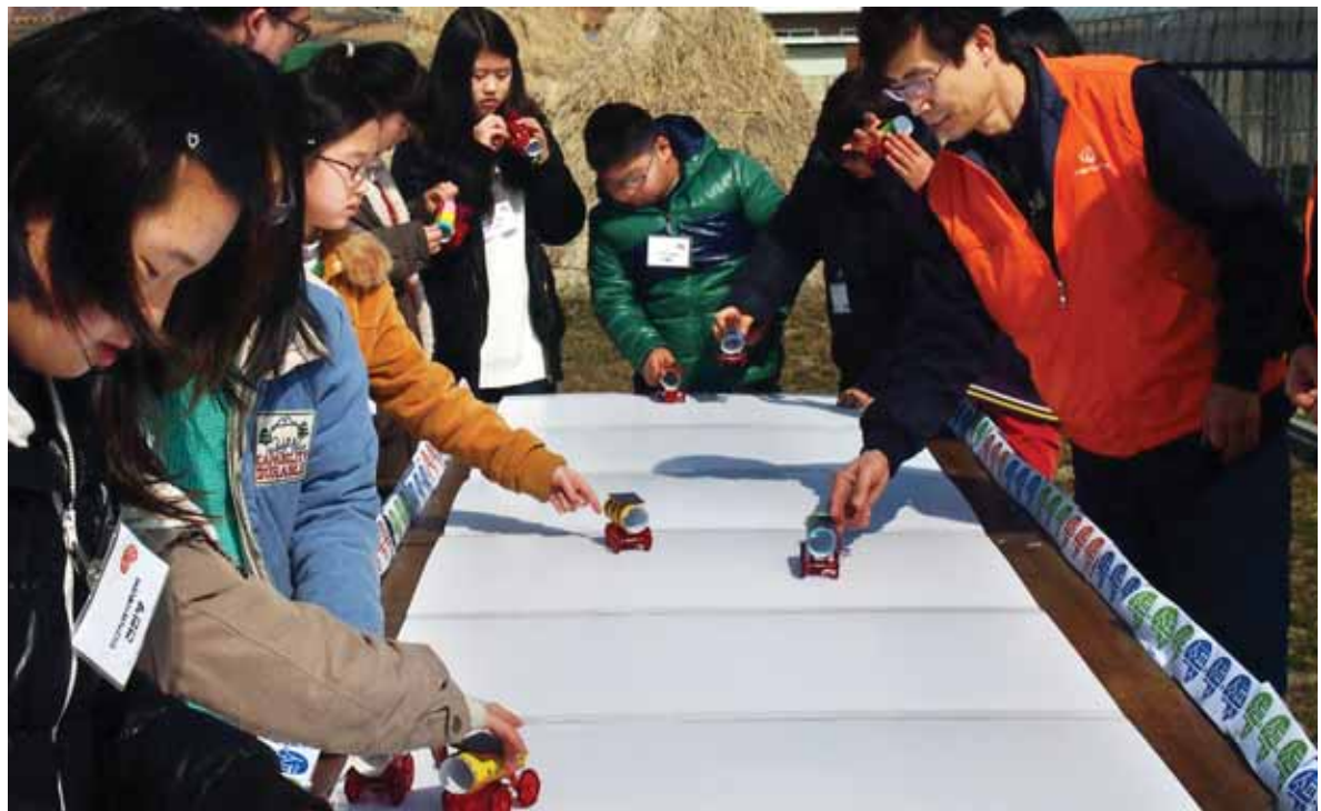
해피 에너지 스쿨

현미경, LED 배양대 등 첨단 기자재를 갖추고 있다. 이 배양관에서는 연간 고구마 조직배양묘 20만본과 감자 기본식물 2만본을 각각 생산할 수 있다. 배양관 준공으로 고품질의 종자와 종묘를 확보하게 돼 고른 품질과 많은 수량의 농산물을 수확하게 됐다고 군은 설명했다. /해남=박희석기자 dia@