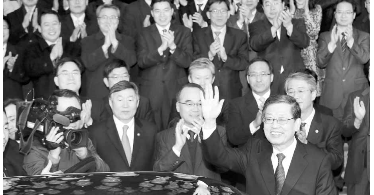
김황식 국무총리가 26일 서울 중로구 세종로 정부서울청사 별관에서 열린 이임식을 마치고 부처 장관 및 직원들의 환송을 받으며 손을 흔들고 있다. /연합뉴스

원전 측은 냉각수 누출 당시 원자로 건물 내부에서 작업하던 직원들은 즉시 원자로 건물 외부로 나와 방사선에 따른 인적 피해는 없다고 밝혔다. 원전 측은 25일 정오께 누출된 냉각수 143kg을 전량 회수했다. 그러나 사고 발생 이틀이 지난 뒤 공개함으로써 은폐하려다가 뒤늦게 공개한 것 아니냐는 의혹을 사고 있다. 월성원전의 한 관계자는 “작업 직원들이 누출된 냉각수에 직접 접촉되지는 않았다”며 “누출 냉각수 제거 등을 거쳐 발효한 것이지 숨겨왔던 것은 아니다”고 말했다. /연합뉴스