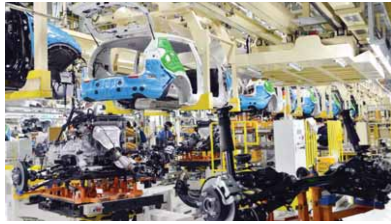
62만대 증산 프로젝트의 핵심인 기아차 광주2공장의 스포티지R 생산 라인.

을 세웠다. 증설을 놓고 4개월 만인 지난해 3월 노사합의를 이룬 뒤 1년이 만에 공장과 설비 증설을 마무리했다. 본격 가동되면 광주공장은 연 매출이 10조원에 달할 것으로 기대된