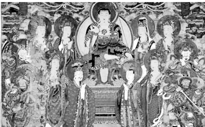
보성 대원사 지상보살도

석가여래삼존좌상(木造釋迦如來三尊坐像) 및 복장유물, 보성선원 목조석가여래삼존좌상(木造釋迦如來三尊坐像) 복장전적도 보물로 지정 예고됐다.