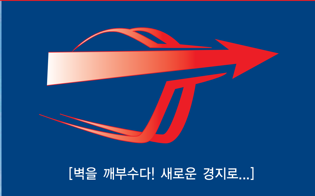
[벽을 깨부수다! 새로운 경지로...]