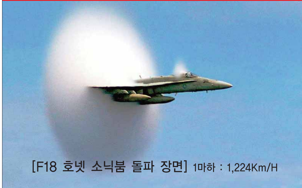
[F18 호넷 소닉붐 돌파 장면] 1마하 : 1,224Km/H