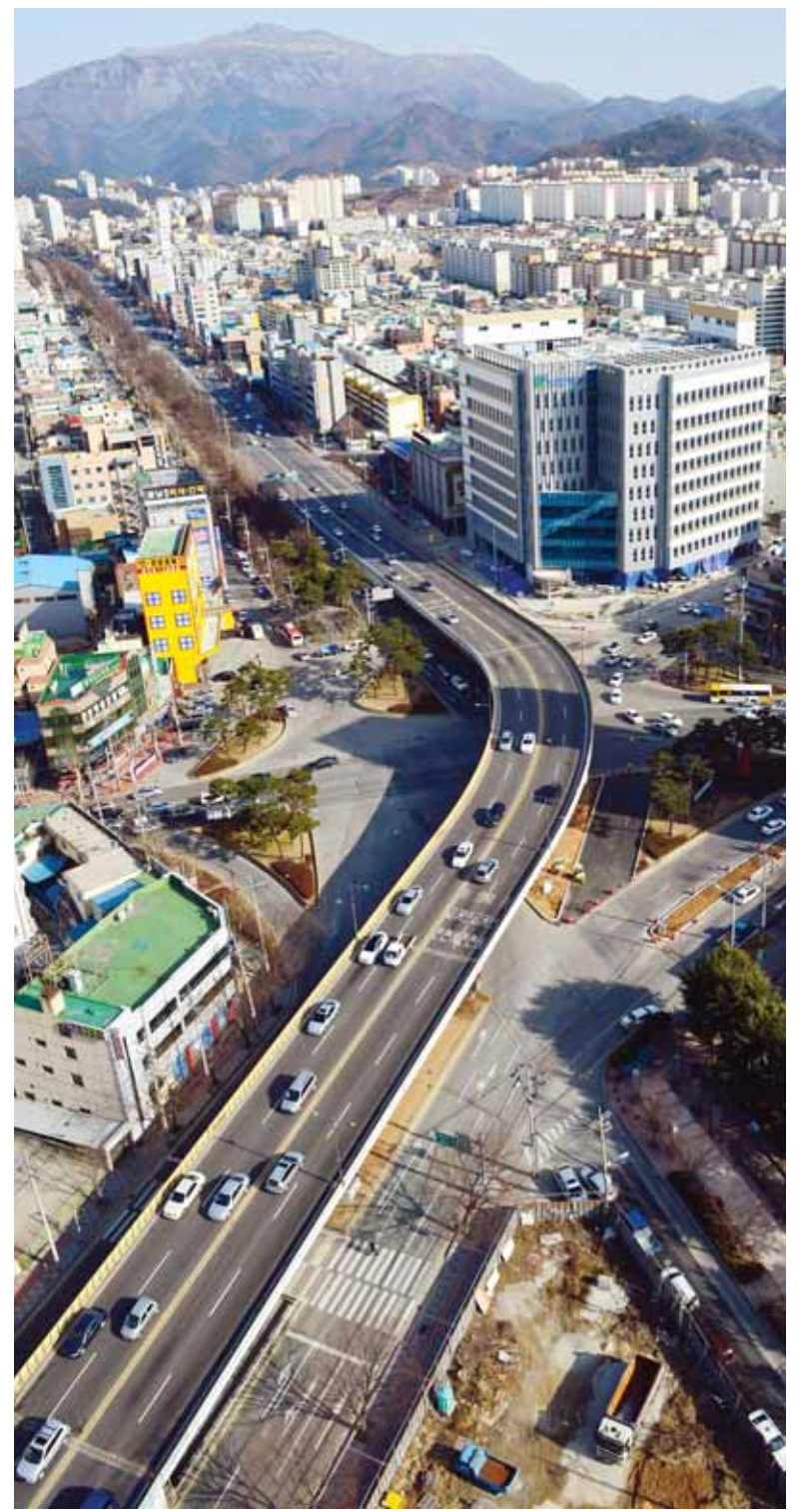
오는 2016년 광주의 대표 교통체증 구간인 백운광장 고가도로(386m)가 철거되고, 지하차도(840m)가 뚫린다. 백운광장 고가도로 위로 차들이 질주하고 있다.

광주 남쪽 관문을 동서로 횡단하는 남구 백운광장 지하차도가 2016년 도시철도 2호선 공사와 동시에 착공될 것으로 보인다. <관련기사 3면> 6일 광주시에 따르면 시는 남구 백운광장에 설치된 고가도로(386m)를 철거하고 길이 840m, 왕복 4차선 지하차도 건설을 추진 중이다. 착공 시기는 도시철도 2호선 건설 시기(2016~2019년)를 고려해 2016년 착공을 목표로 하고 있다. 도시철도 2호선 공사 때 동일노선으로 바로 위에 지하차도를 만들기 위해서다. 지하 1층은 지하차도, 지하 2층은 지하철 노선이 되는 것이다. 지하차도 건설지점은 현 남구청 신청사 앞 백운고가 동쪽 시작점에서 동아병원 앞 교차로를 통과해 서쪽 끝을 월산동 신우아파트 앞 도로까지 늘리게 된다. 백운지하차도가 건설되면 광주·전남에서 가장 긴 지하차도가 된다. 현재로서는 지난 2007년 광주 임방울대로에 건설된 수완지하차도(720m)가 가장 길다. 고가도로가 철거되고 지하차도가 건설되면 주변 차량흐름 개선과 상권 활성화에 기여할 것으로 광주시는 전망하고 있다. 특히 백운광장 앞에 들어서서 남구청 신청사의 접근이 편리해질 것으로 기대된다. 지하차도 건설비용은 총 550억원이며, '위험도로 구조개선사업'으로 행정안전부로부터 총 공사비의 50%인 275억원을 확보했다. 다만, 도시철도 2호선 공사와 함께 지하차도 공사를 실시할 예정이어서 국토해양부로부터 총 공사비의