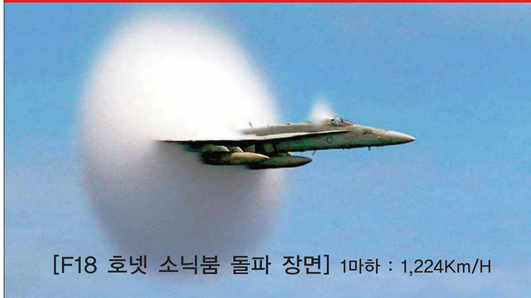
[F18 호넷 소닉붐 돌파 장면] 1마하 : 1,224Km/H