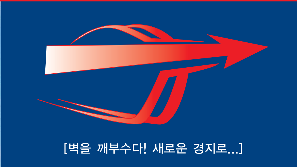
[벽을 깨부수다! 새로운 경지로...]