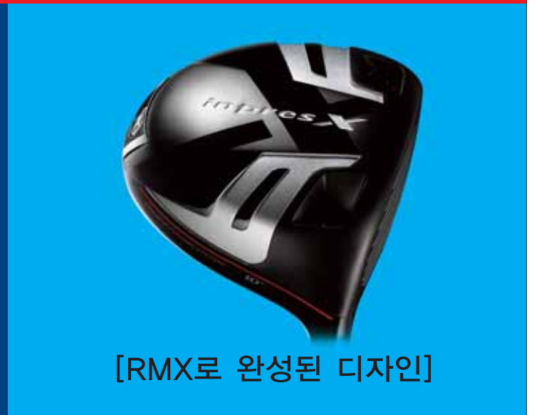
[RMX로 완성된 디자인]

RMX(리믹스) = 서로 다른 가치의 융합을 통해 만들어 지는 새로운 가치