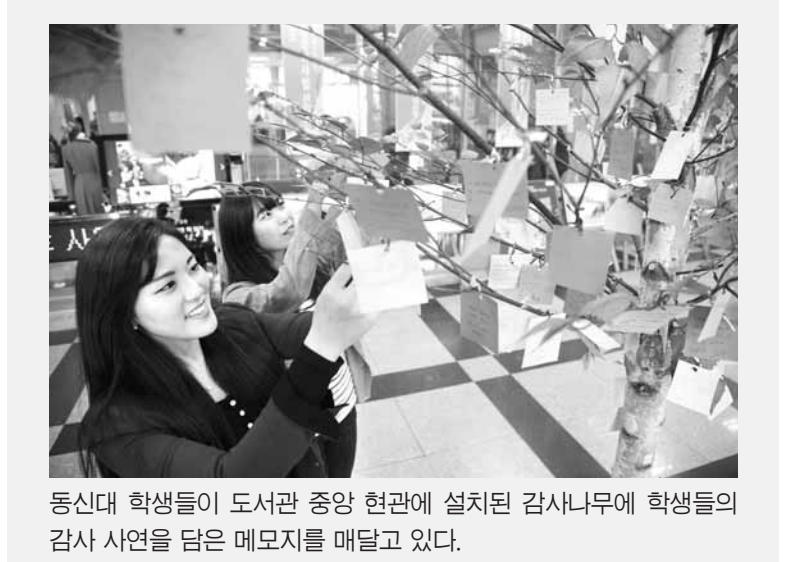
동신대 학생들이 도서관 중앙 현관에 설치된 감사나무에 학생들의 감사 사연을 담은 메모지를 매달고 있다.

호남대 IT스퀘어 직업체결 운영기관 선정 호남대학교 IT스퀘어(단장 정영기)가 2년 연속 광주시교육청 진로직업체결프로그램 운영 유망기관으로 선정됐다. 호남권 유일의 정보통신 체험교육전시장인 호남대 IT스퀘어는 광주·전남 청소년들을 대상으로 IT스퀘어 전시관 체험뿐만 아니라 입체영상의 원리를 알아보고 입체사진을 제작해보는 문화 콘텐츠 전문가 직업체결, IT진로 특강, 직업흥미탐색 등의 프로그램을 제공하고 있다. IT스퀘어는 올해 청소년 진로 직업체결프로그램 참여학생들에게는 입장료를 제외한 일체 비용을 받지 않고 대학의 교육기부 형태로 운영하고 있다. 학교단체에 한해서만 신청이 가능하다. 프로그램 참가 신청은 선착순으로 마감하며, 학기 중 체험학습이 집중되는 4월부터 10월까지 학기 중급요일의 경우 이미 신청자 거의 마감돼 신청일자를 조정해야 한다. /채희중기자 chae@kwangju.co.kr