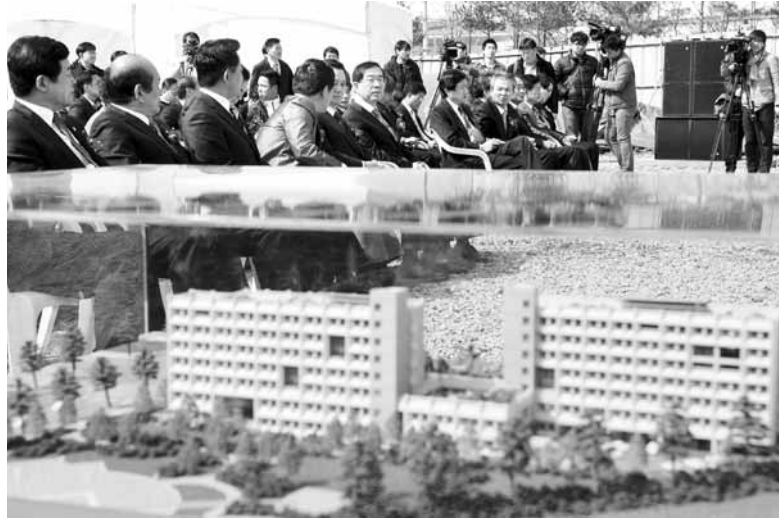
18일 서울 강서구 내발산동 '희망동지 대학생 공공기숙사' 1호 착공식에 참석한 자치단체장들이 대화를 나누고 있다.

서울시와 순천시·나주시·고흥군 등 전국 7개 지방자치단체가 협력해 건설하는 지방학사가 강서구 내발산동에서 첫 삽을 떴다.