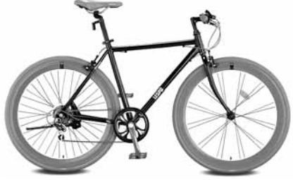
삼천리 자전거 솔로 700C