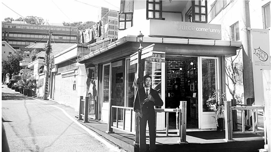
다형 김현승 시인을 기리기 위해 광주시 남구 양림동 한 건물 2층에 만든 무인카페 '다형다방' 전경.