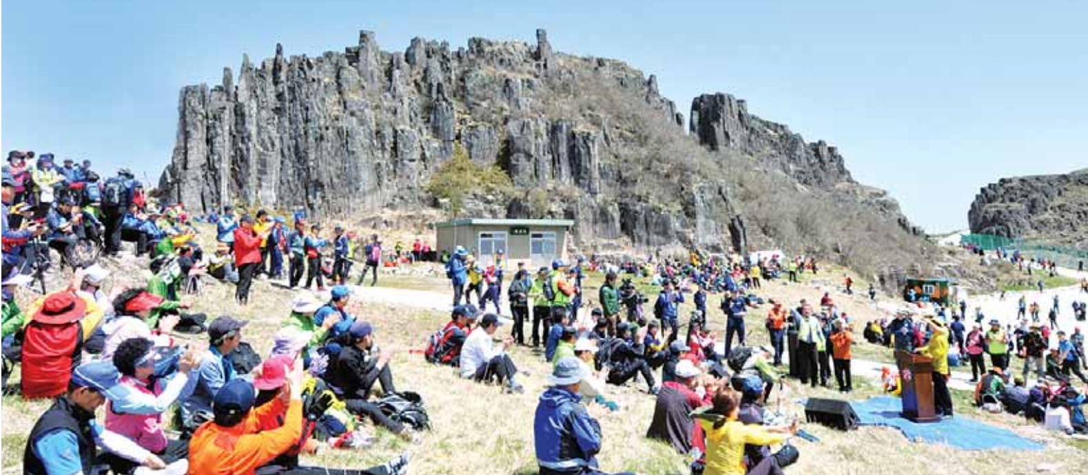
무등산 국립공원 면적의 21%를 차지하고 있는 화순군에는 쾌적하고 여유로운 등반로가 개설돼 한결 느긋한 나들이가 가능하다. 화순 쪽에서 무등산 정상에 오른 탐방객들이 절경을 만끽하며 휴식을 취하고 있다.

“화순의 무등산국립공원에서 쾌적하고 여유있는 봄나들이를 즐기세요.” 화순군 내 무등산국립공원이 새로운 ‘힐링 장소’로 떠오르고 있다. 지난해 전국에서 21번째 국립공원으로 지정돼 지난달 4일부터 효력을 발생한 무등산은 공원면적 75.425km 2 중 화순군이 15.802km 2 를 차지해 전체의 20.9%를 점유하고 있다.