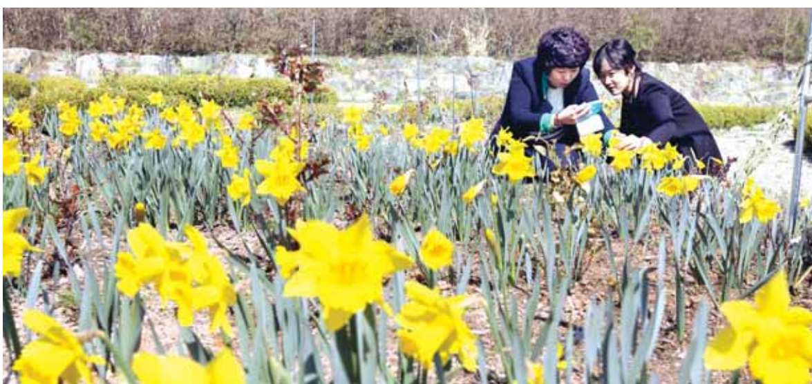
3일 함평군 자연생태공원에 활짝 핀 노란색 수선화들이 장관을 이루고 있다. 이곳에는 매년 봄에 수선화 수만 포기 꽃을 피워 행락객들의 눈길을 사로잡고 있다.

달간 부족한 용수 확보를 위한 대비체제에 들어갈 예정이다. 농어촌공사는 어린모 재배와 본격적인 모내기에 대비한 지속적 용수 확보를 위해 주요 저수지에 대한 현장 점검을 강화할 예정이다. 일부 개보수와 준설 등의 영향으로 저수율이 낮은 저수지에 대해서는 하천양수 등 특별 대책을 수립, 시행하기로 했다. 또 농업용 저수지 수질 진수조사와 구제역 침출수 누출예방 등 수질관리를 본격적으로 강화해 나갈 계획이라고 덧붙였다. 한편 전국적으로 저수지 수문을 열어 농업용수 공급 시작을 알리는 통수시행사가 이달 3일부터 지역별로 개최되는 가운데 전남지역분부는 11일부터 장흥을 시작으로 각 지자체별 통수시행 열 예정이다. /김대성기자 bigkim@