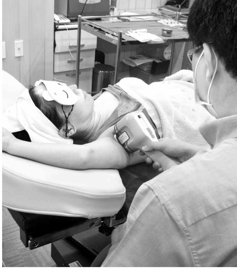
신심식 상무 맑은피부와 원장이 여름철마다 겨드랑이 냄새 때문에 시달리는 20대 여성에게 미라드라이 시술을 하고 있다.