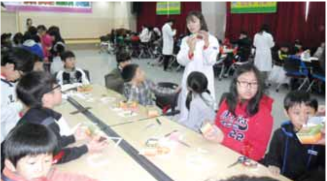
한국여성과학기술인지원센터와 에너지관리공단 광주전남지역 본부는 지난 20일 에너지관리공단 광주전남지역본부에서 초등학생 150명과 학부모 50명이 함께하는 '제 6회 일과와 함께하는 SESE나라 과학캠프'를 진행했다.