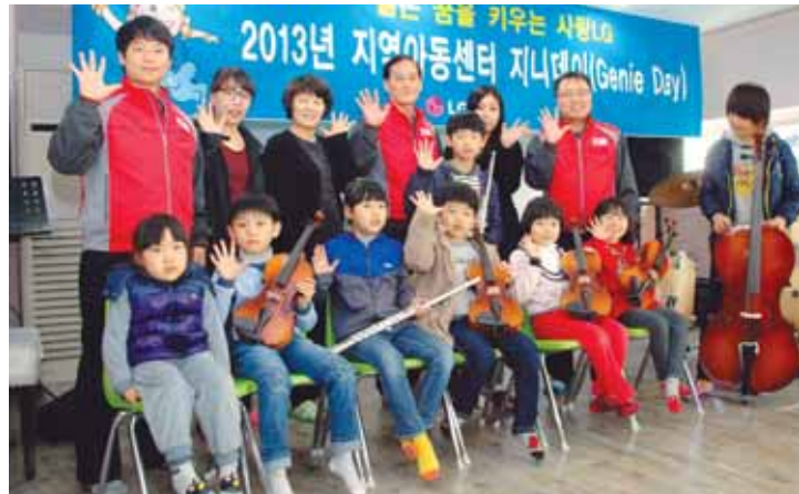
소년들이 진정 필요로 하는 것을 지원하고 소원을 들어주는 '지니데이'를 통해 아이들이 건강하고 바르게 성장하길 바란다”고 밝혔다.