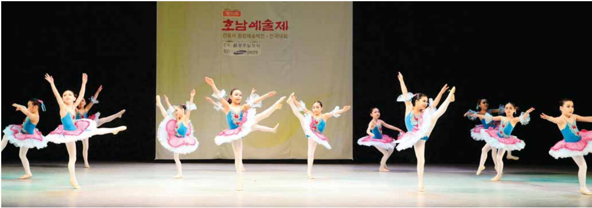
호남예술제 개막...새싹들의 군무

24일 광주학생교육문화회관에서 개막한 제58회 호남예술제 무용 경연에서 광주송원초 학생들이 발레 '꿈꾸는 소녀들'을 선보이고 있다. 무용·국악·음악·합주·미술·작문 등으로 나눠 진행되는 호남예술제는 다음달 24일까지 계속된다. <임상자 명단 12면>