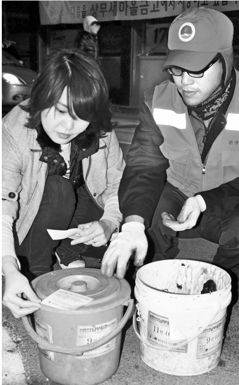
단독주택, 소형음식점을 대상으로 실시해온 음식물쓰레기 종량제가 배출량 감소 효과가 큰 것으로 나타나면서 광주시가 올해부터 공동주택까지 확대하는 계획에 탄력이 붙을 전망이다. 사진은 종량제 시행 첫 날인 지난해 12월1일 광주시 서구 관계지와 환경미화원이 스티커 미 부착 용기에 계도용 스티커를 붙이는 모습.