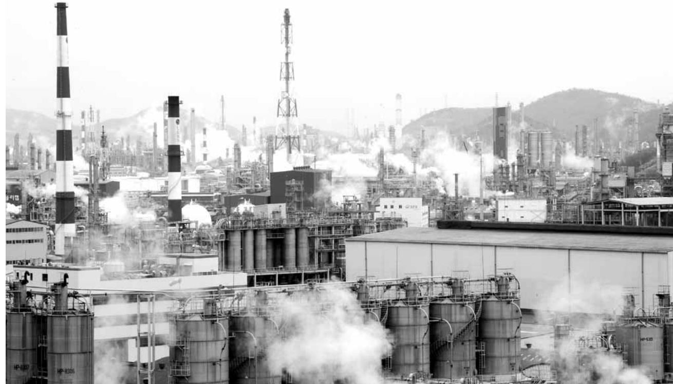
여수 산단 내 가동중인 기업들 220여개 중 1급 발암물질을 다루는 석유화학업체는 60곳에 이른다. 사진은 여수산단 전경.