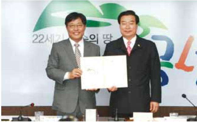
곡성군은 최근 순천지역 의료기관을 이용하는 주민들이 질 높은 의료서비스를 받도록 하기 위해 순천중앙병원과 자매결연 협약식을 가졌다.