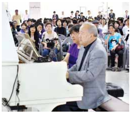
최고 흥행작이었다. 병원측이 사전에 준비해놓은 200석이 모두 찼으며 100여명은 서서 공연을 관람하기도 했다.

이날 콘서트는 전남대병원이 지난해 말부터 매달 개최한 작은 음악회중 가장 많은 관객이 모인