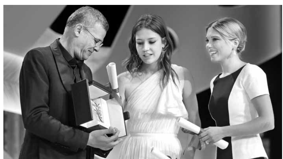
제66회 칸국제영화제에서 26일(현지시간) 황금종려상을 받은 프랑스 영화 '블루 이즈 더 워머스트 컬러(Blue Is The Warmest Colour)'의 감독 알베라티프 케시시와 출연배우 아델 에그자르코폴로스, 레이 세이두(사진 왼쪽부터).

칸영화제 황금종려상이 튀니지 출신 프랑스 감독 알베라티프 케시시의 '블루 이즈 더 워머스트 컬러'(Blue Is The Warmest Colour)에 돌아갔다. 한국영화는 올해 경쟁 부문에는 초청받지 못했지만, 문병곤(30) 감독의 단편 '세이프'(Safe)가 단편 경쟁 부문에서 황금종려상을 받았다.