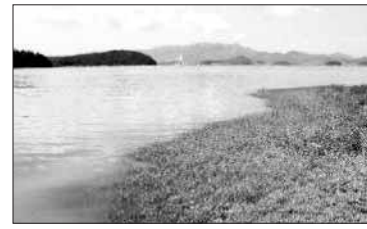
⑦ 해안 갯잔디군락(계도)