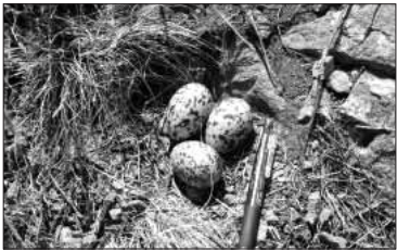
⑤ 검은머리 물떼새(술섬)