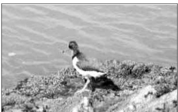
④ 어린 검은머리물떼새(잠두도)