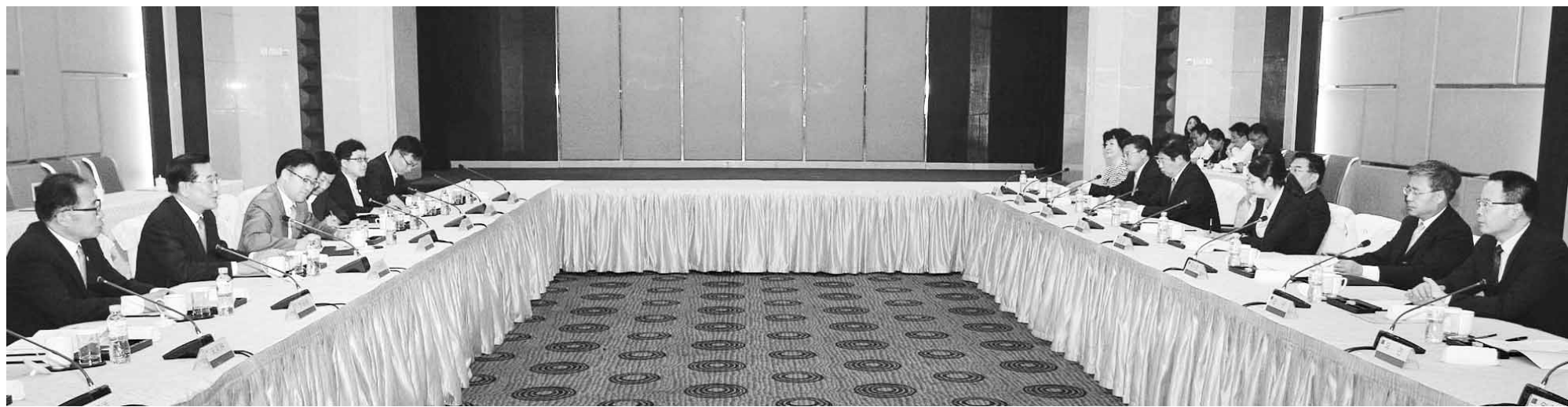
박준영 전남지사, 中 방문 교류촉진 논의

투자유치와 교류촉진을 위해 중국을 방문 중인 박준영 도지사가 17일 산둥성 산둥호텔에서 귀수칭 산둥성장 등 중국 관계자와 교류 확대방안을 논의하고 있다.