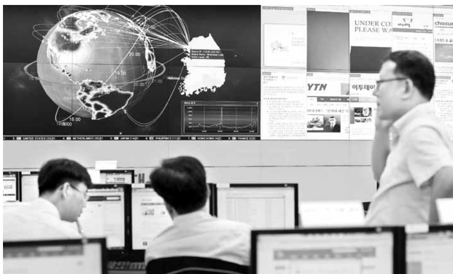
청와대와 국무조정실 및 일부 언론사 홈페이지가 외부세력에 의해 해킹당한 25일 오후 서울 송파구 가락동 한국인터넷진흥원 인터넷침해대응센터에서 관계자들이 민간사이트 피해상황을 예의 주시하고 있다.

정부는 25일 청와대와 국무조정실 홈페이지가 위·변조되고 일부 언론사 서버가 공격당한 사실을 확인하고 이날 오전 10시45분 사이버위기 '관심' 경보를 발령했다. 정부는 이날 미래창조과학부, 안전행정부, 국방부, 국가정보원 등 10개 부처 담당관이 참석한 가운데 '사이버위기 평가회의'를 열고 이같이 결정했다. 이번 공격과 관련해 정부는 합동조사팀을 꾸려 원인 조사에 착수했지만, 공격 주체를 아직 확인하지는 못했다. 청와대 홈페이지 해킹외에 이날 오전 안행부·미래부·통일부의 홈페이지에도 접속 장애가 발생했고, 일부 언론사 및 새누리당의 일부 시도당 인터넷 홈페이지도 해킹 의심사례가 나타났다. 미래부는 "일부 정부부처 홈페이지 접속 장애는 정부통합전산센터의 도메인 네임 시스템(DNS)의 트래픽 장애에서 비롯된 것으로 파악됐다"며 "청와대 해킹과 연관성이 있는지 확인 중"이라고 밝혔다. 새누리당의 경우 이날 오전 11시30분 현재 16개 시도당 가운데 서울·경기·인천 등 수도권 전역과 부산·울산·강원·경북 등 8개 시도당 홈페이지에서 해킹의심사례가 나타났다. 새누리당 광주시당은 해킹의심 사례가 나타