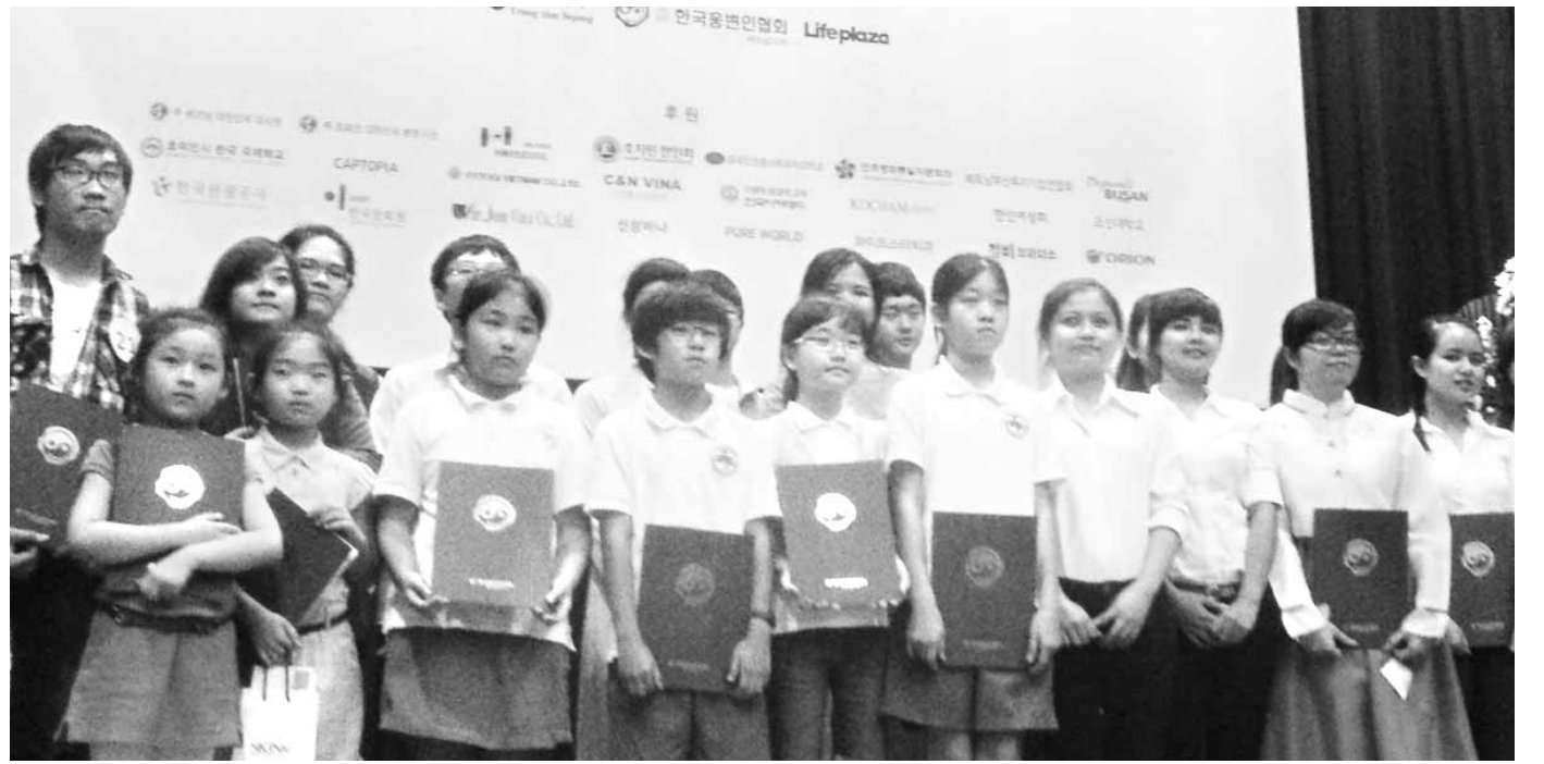
베트남 웅변대회 수상자들이 무대에서 시상후, 기념 촬영을 하고 있다.

광주시교육청 관계자는 "교육력 제고와 교원의 신뢰를 얻을 수 있는 방향으로 승진 규정을 개정하려 한다"며 "무리하게 추진하지 않고 충분히 공감대를 형성해 추진하겠다"고 밝혔다. /박정욱기자 jwpark@