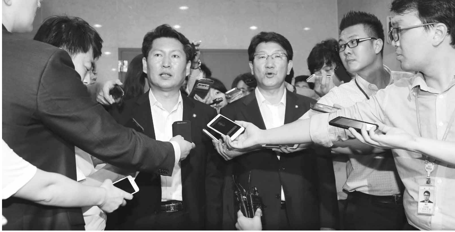
'국정원 국정조사 특위' 정청래 민주당 간사(왼쪽)와 권성동 새누리당 간사가 1일 오후 국회 정론관에서 국정조사계획서 관련 여야 합의사항을 발표한 뒤 취재진의 질문에 답하고 있다.