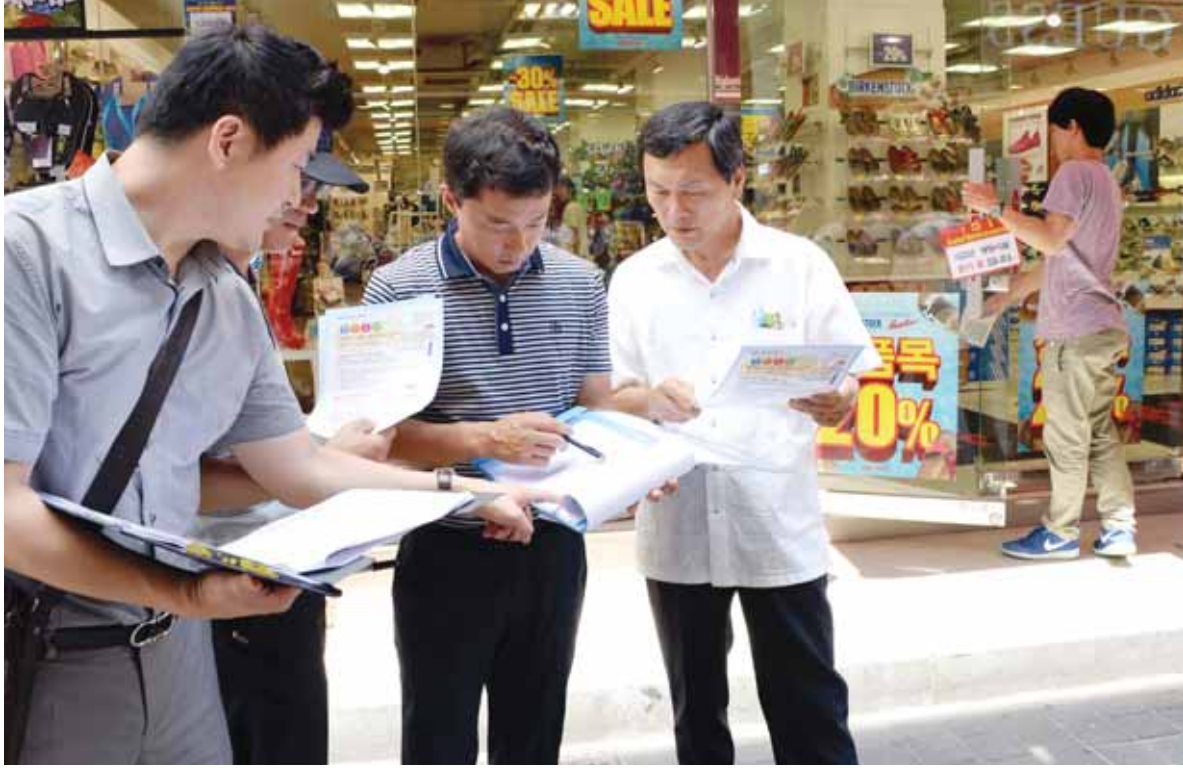
1일 오후 1시30분 광주시와 동구, 에너지관리공단, 한전 등으로 구성된 합동 단속반이 냉방기를 컨 상태에서 문을 열어 놓고 영업을 하는 사업장에 대한 단속을 시작하고 있다.