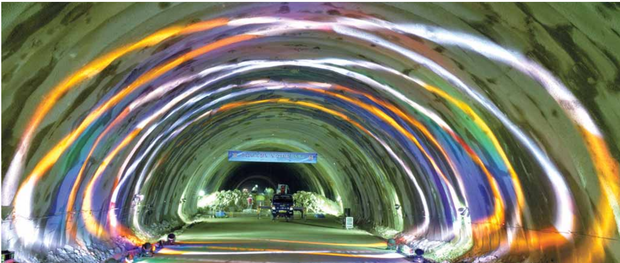
호남고속철 노령터널 관통

호남고속철도 건설 구간 중 장성군 북이면과 정읍시 입암면을 연결하는 노령터널(4300m)이 최근 관통됐다. 착공(2010년 7월) 2년11개월 만에 890억원의 사업비가 투입됐고 연인원 3만8000명, 덤프트럭 등 장비 2만200대가 동원됐다. 터널 공사에서 파낸 토사량만 74만5000m로 잠실아구장만한 넓이를 70m 높이로 채울 수 있는 양이다.