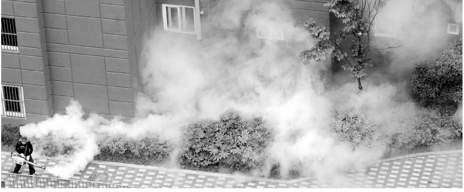
여름철 방역 2일 광주시 광산구 수완동 한 아파트에서 광산구청 소속 방역기동반이 모기 등 위생 해충 퇴치를 위한 방역소독을 하고 있다.