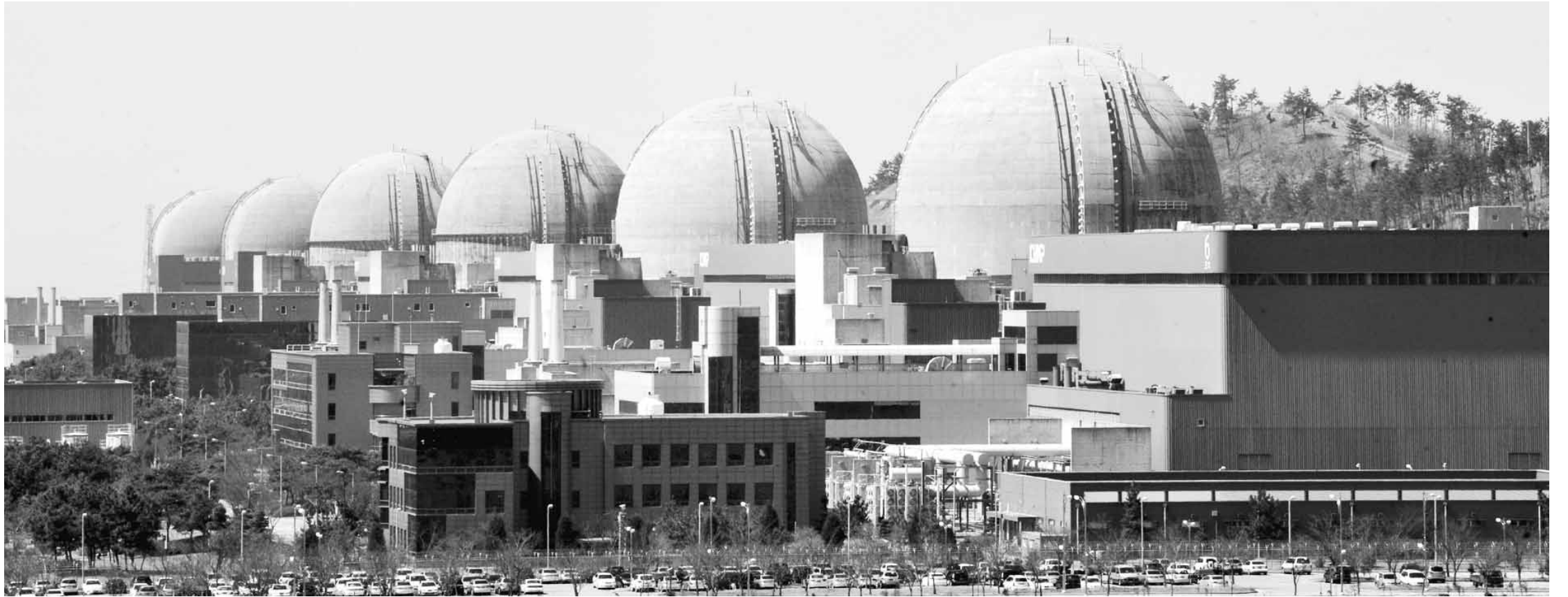
잇단 원전 가동중단으로 원전의 안전성이 의심되고 블랙아웃(대규모 정전사태)까지 걱정하는 지경에 이르면서 신재생에너지 개발 등 에너지 정책의 근본적인 변화를 요구하는 목소리가 높다. 한빛원전 전경.